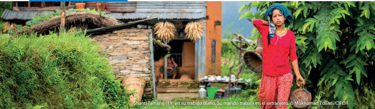
Shanti Tamang (19) en su trabajo diario. Su marido trabaja en el extranjero.