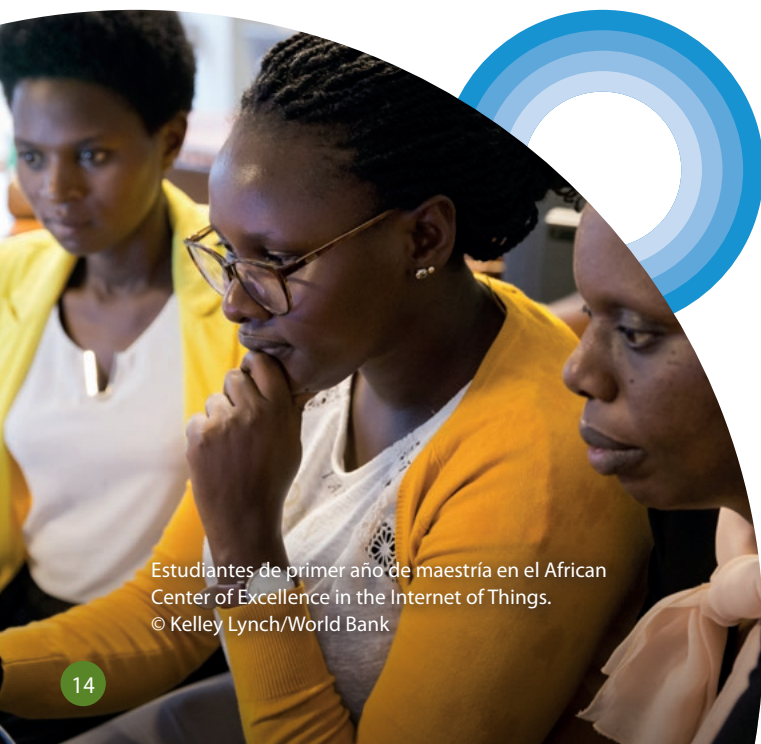
Estudiantes de primer año de maestría en el African Center of Excellence in the Internet of Things.

IPCC (2019). Climate Change and Land: An IPCC Special Report on climate change, desertification, land degradation, sustainable land management, food security, and greenhouse gas fluxes in terrestrial ecosystems . Shukla, P. R., Skea, J., Buendia Calvo, E., Masson-Delmotte, V., Pörtner, H-O. et al. (Eds.). Cambridge, RU y Nueva York: Cambridge University Press http://www.ipcc.ch/srcl