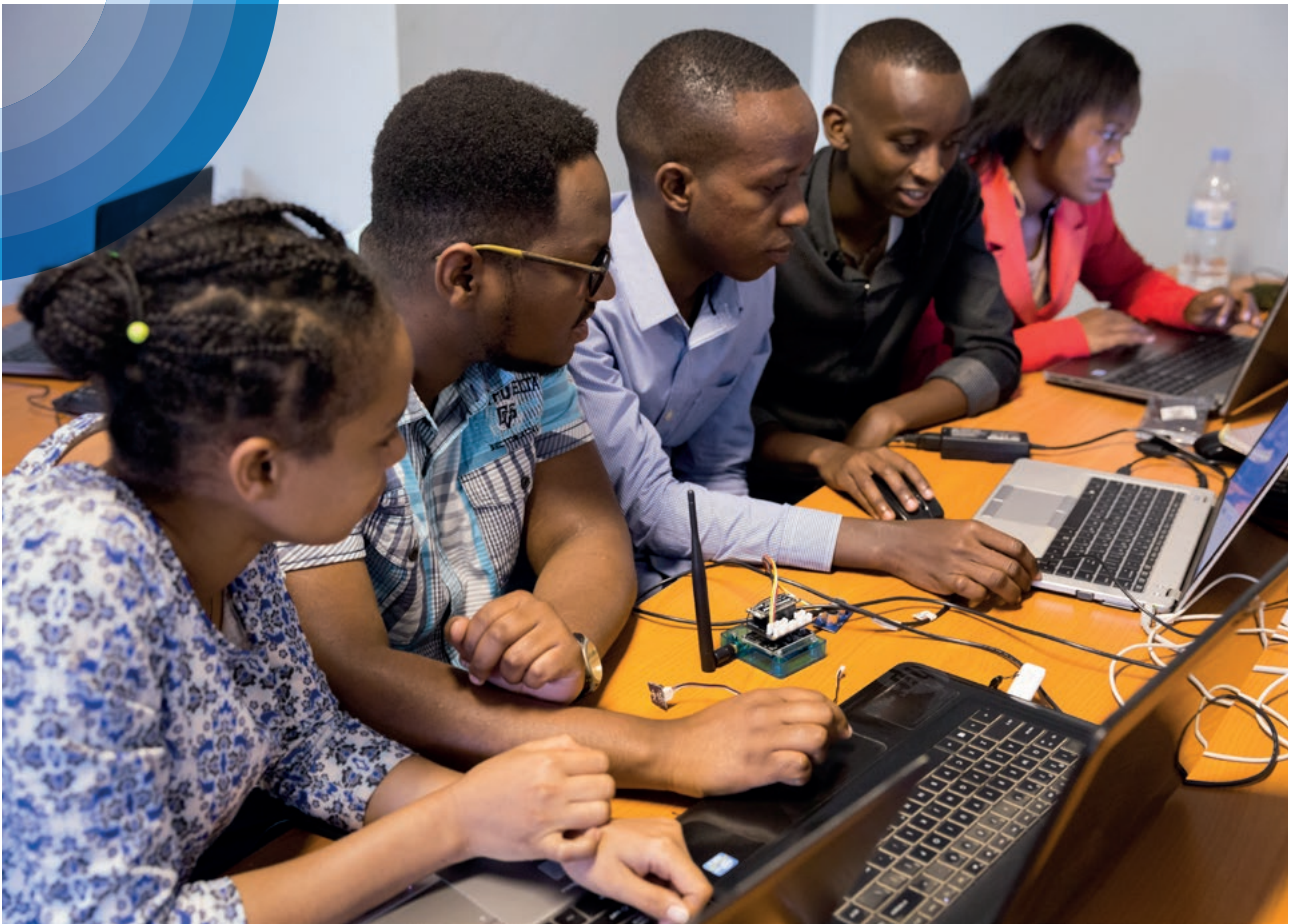
Estudiantes de primer año de maestría en el African Center of Excellence.