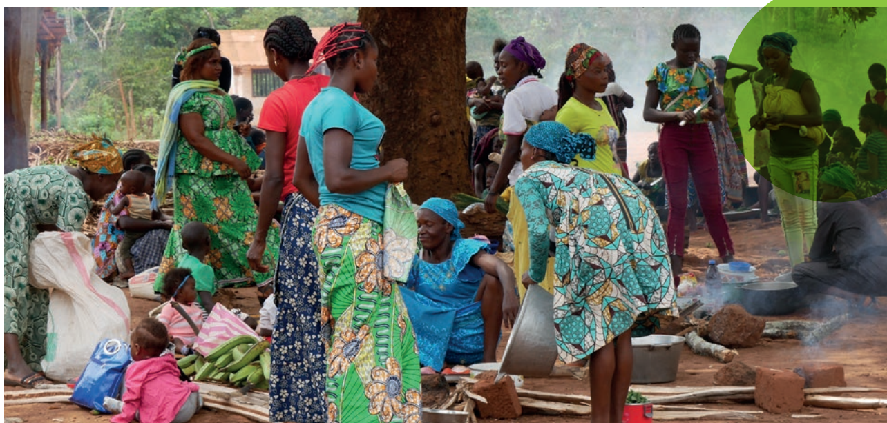
Proyecto de mujeres sobre seguridad alimentaria y bosques, Camerún.

Un ejemplo de cómo la investigación-acción bajo GLOW está integrando el empoderamiento económico de las mujeres en todos los sectores en el contexto de la recuperación de Covid-19 es el proyecto 'Transición energética para el empoderamiento económico de las mujeres en la cadena de valor hortícola en Senegal y Guinea'. El proyecto tiene como objetivo mejorar el empoderamiento económico de las mujeres involucradas en la cadena de valor hortofrutícola, y lo hace vinculándose con el acceso a sistemas de energía limpia. Proporcionará evidencia de los beneficios del acceso y control de las mujeres a los sistemas de riego impulsados por energía solar. Esta evidencia informará las decisiones para el establecimiento de un marco regulatorio y políticas públicas para apoyar la adopción a gran escala de dichos sistemas. Para obtener más información sobre este y otros proyectos GLOW, visite: https://glowprogramme.org .