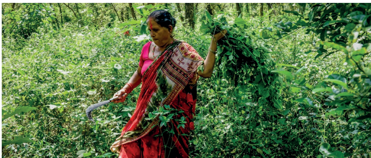
Mujeres del Grupo de Usuarios del Bosque Comunitario de Binayi recolectan lantana para abono verde.

Las políticas climáticas pueden tener una tendencia a ser abordadas de manera tecnocrática y patriarcal excluyendo a las mujeres (Westholm y Arora-Jonsson, 2018). Bhusal et al., (2020) y Bhusal y Khatri (2020) describen cómo los primeros esfuerzos para implementar la agricultura climáticamente inteligente en Nepal se centraron en los hombres como usuarios arquetípicos de las mismas. Solo después de que se completaron las pruebas de campo, se adaptaron las tecnologías para que fueran más adecuadas físicamente para las mujeres y preferidas por ellas. Este cambio a una programación sensible al género fue vital, dado que los hombres han emigrado de muchos distritos rurales en busca de trabajo a otros lugares, haciendo que la mayoría de agricultores en estas áreas sean mujeres.