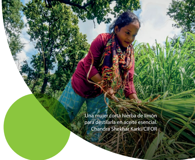
Una mujer corta hierba de limón para destilarla en aceite esencial.

En políticas, la integración es generalmente pobre, aunque hay algunos avances. El 40% de las Contribuciones Determinadas a Nivel Nacional (NDC en inglés) presentadas por los países a la Convención Marco de las Naciones Unidas sobre el Cambio Climático (CMNUCC) en 2015–16 mencionaron "género" (UICN, 2021). Cuando se presentó la segunda ronda de NDC en 2020–21, el 78 % mencionó "género" (UICN, 2021:).